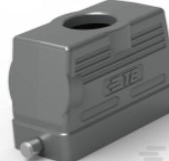
TE 系列/零件编号 T1320160121-000 H16B-TG-RO-PG21