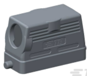
TE 系列/零件编号 T1310160121-000 H16B-TS-RO-PG21