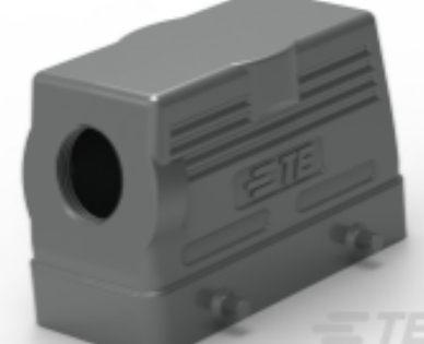
TE 系列/零件编号 T1210160125-000 H16B-TS-M25