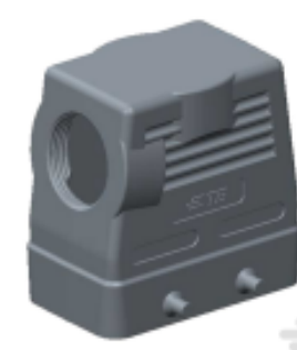
TE 系列/零件编号 T1230160140-000 H16B-TSH-M40