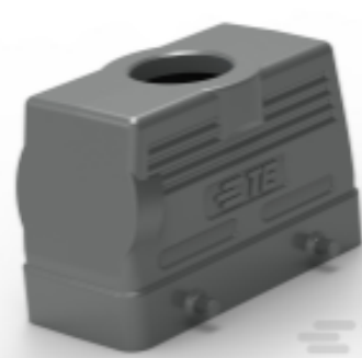
TE 系列/零件编号 T1220160132-000 H16B-TG-M32