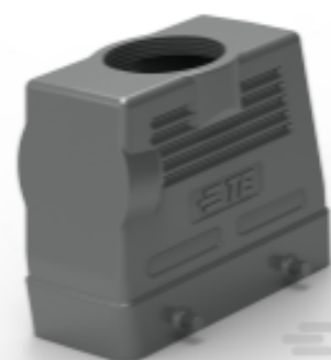
TE 系列/零件编号 T1240160140-000 H16B-TGH-M40