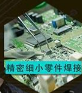
精密细小零件焊接