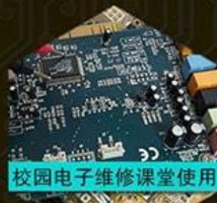
校园电子维修课堂使用