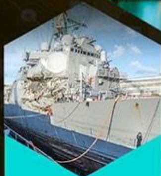
航运电子设备维修