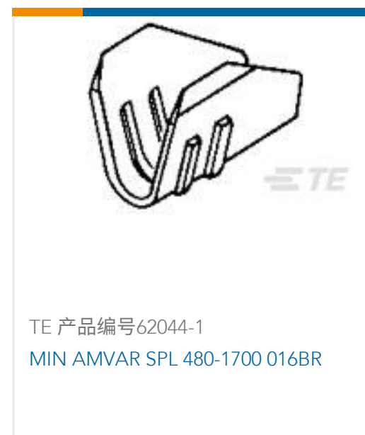
TE 产品编号62044-1 MIN AMVAR SPL 480-1700 016BR