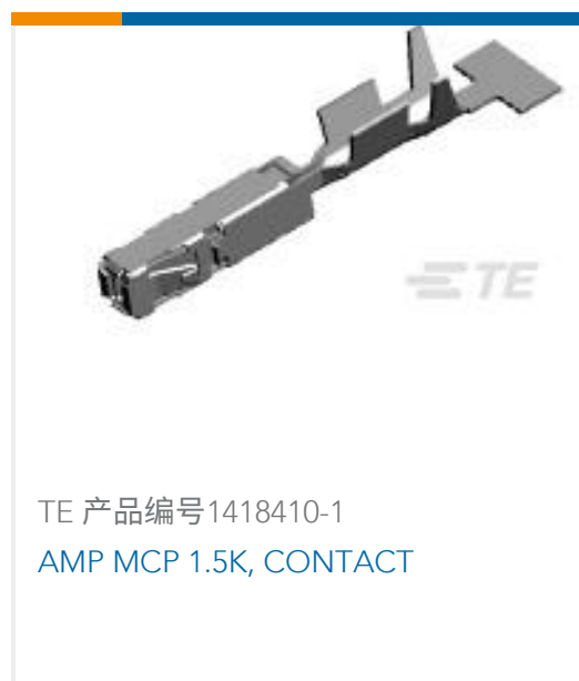
TE 产品编号1418410-1 AMP MCP 1.5K, CONTACT