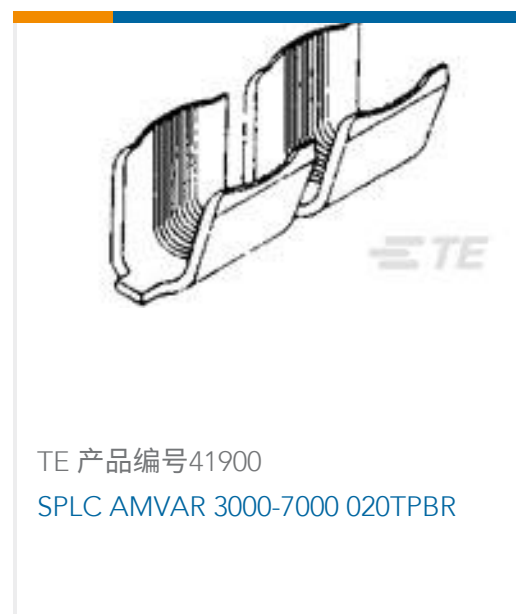
TE 产品编号41900 SPLC AMVAR 3000-7000 020TPBR