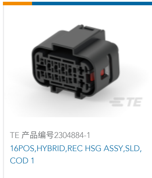
TE 产品编号2304884-1 16POS, HYBRID, REC HSG ASSY, SLD, COD 1