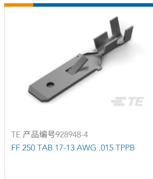
TE 产品编号928948-4 FF 250 TAB 17-13 AWG .015 TPPB