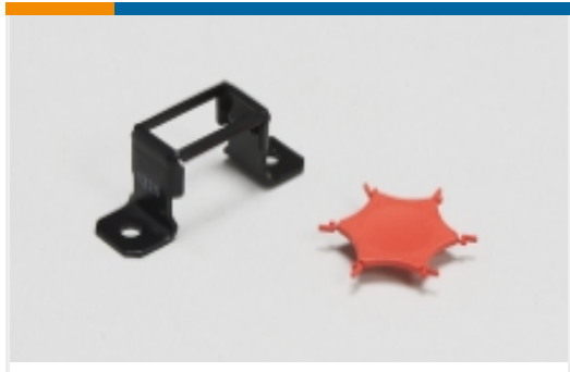
接线端子和端子排安装固定附件(1)