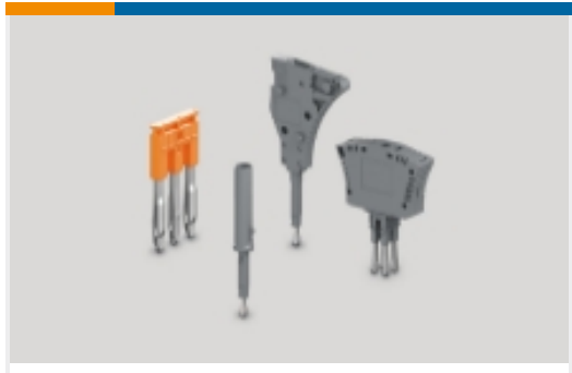
接线端子和端子排导电附件(25)