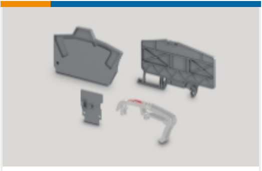
接线端子和端子排绝缘附件(7)