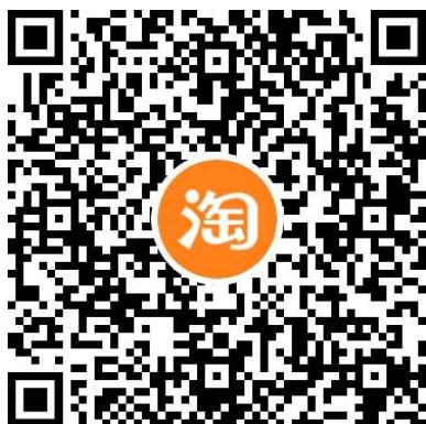
微智达淘宝官方旗舰店