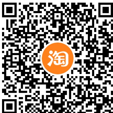
微智达淘宝官方旗舰店