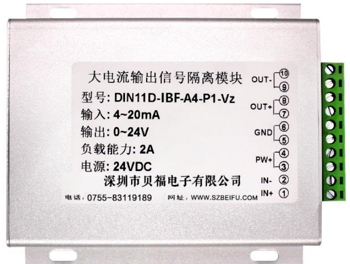
图 1 模块外观图